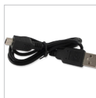
Cavo di alimentazione USB